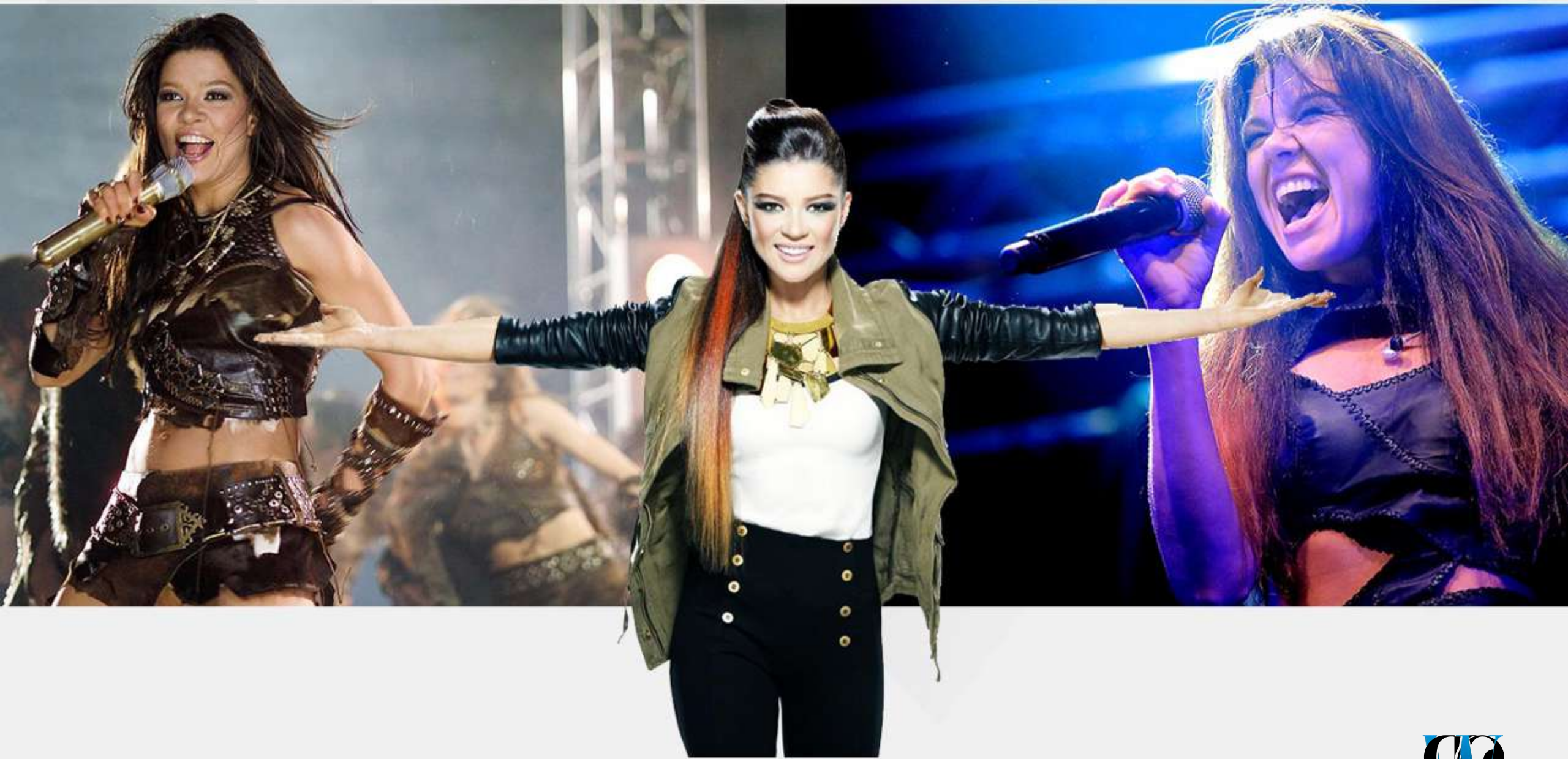
RUSLANA EUROVISION WINNERS